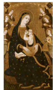
Virgen de la Leche. Maestro de Villahermosa. 1940 (Catedral de Valencia)