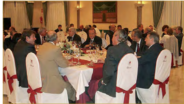
La cena fue celebrada en uno de los salones del restaurante Palasiet de Xàtiva