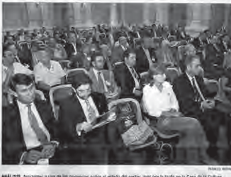
ANÁLISIS. Asisten a una de las ponencias sobre el estado del sector, aquí por la tarde en la Casa de la Cultura.

El sector funerario en España tiene un peso relativo y que destaca por el comercio, se erigió con un sector tan específico como el funerario alcanza una dimensión tan relevante. Con una actividad que se remonta a hace más de siete de-